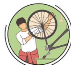
RÉPARATION DE MATÉRIEL SPORTIF

Nous souhaitons mettre en place la réparation de matériel sportif grâce à l'aide de l'université. En effet, cette dernière propose déjà un service de réparation. Notre objectif est de s'allier à eux et que nous soyons complémentaire afin de satisfaire au mieux les étudiants. Ce principe est important pour nous car de nombreux étudiants arrêtent leurs pratiques dès lors que leur matériel se casse car la réparation coûte cher.