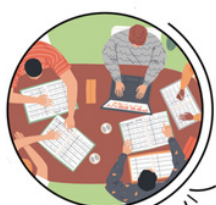
FORMATION À LA GESTION D'UNE FRIPERIE

À l'ouverture de cette friperie sport planète, nous devons en assurer la gestion. C'est pourquoi nous prévoyons de suivre des formations afin que chaque personne de la Corpo STAPS Nice soit capable d'en assurer le fonctionnement. Mais aussi, si des étudiants souhaitent s'investir dans ce projet, être en capacité de les former sur tout ce qui la concerne. Et pourquoi pas, si le projet se développe comme nous le souhaitons, envisager de recruter une personne en Service Civique afin d'apporter son aide sur les avancées du projet et sa bonne gestion.