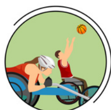
DÉCOUVERTE DE PRATIQUES SPORTIVES ET PARASPORTIVES

Étant en STAPS, la pratique sportive est le principal objet de notre formation, nous voulons la développer à travers cette friperie sport planète en promouvant nos événements sportifs sur le territoire. Nous ne visons pas uniquement nos étudiants en formation STAPS, ce qui nous permet d'étendre la pratique sportive à tous les étudiants niçois et leur permettre l'accès par ce que l'on propose à petit prix.