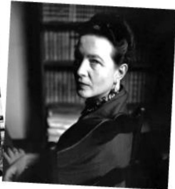
Elliott Erwitt, 1952