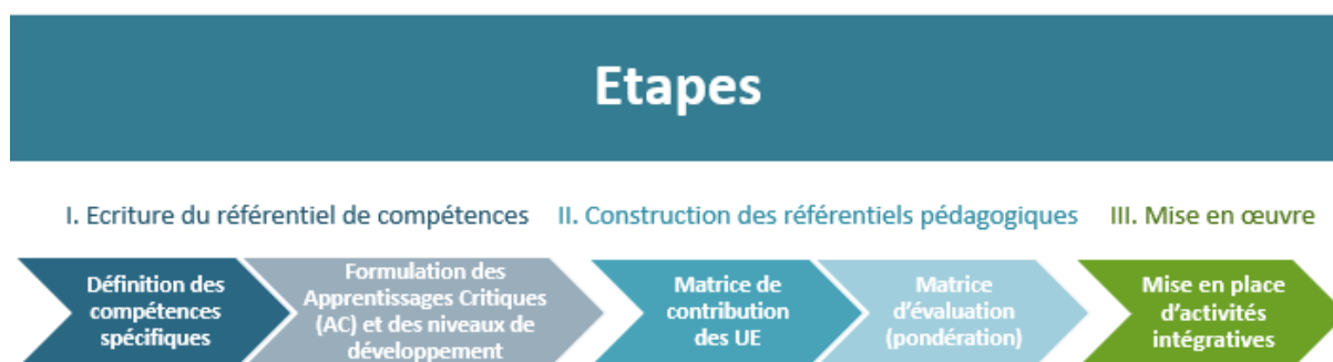
Figure 1: Description des différentes étapes de la démarche de mise en œuvre de l'approche par compétences à UCA

Ces 3 objectifs sont décrits dans la figure 1 et détaillés dans les sections qui suivent.