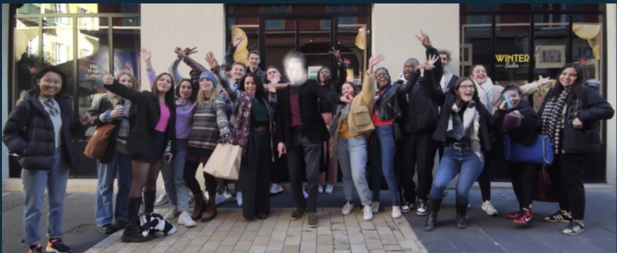
Master class du vendredi 20 janvier 2023 (libre de droit), crédit : inconnu

La pédagogie innovante répondra à 3 objectifs : rencontrer, pratiquer et connaître à travers des médiations et des ateliers qui rythmeront l'enseignement des étudiants.