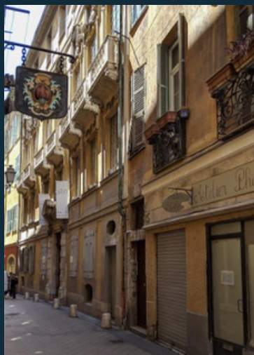
Palais Lascaris