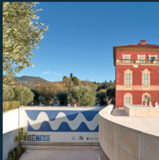
Musée Matisse