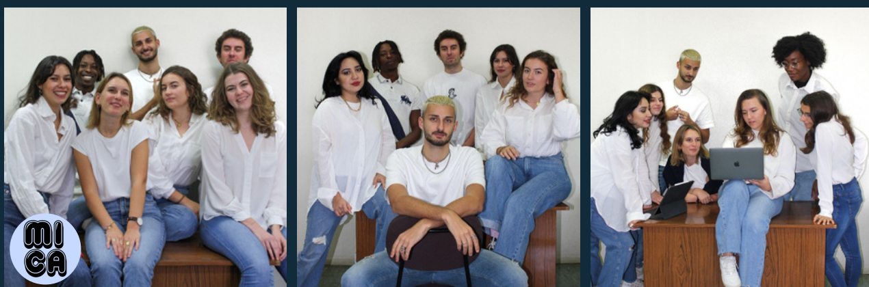
Étudiants du master 2 EMIC et membres de l'association MICA

“Le parcours Événementiel, Médiation et Ingénierie Culturelle du master information et communication d'Université Côte d'Azur, forme des cadres capables de coordonner et de diriger des projets ou d'assister les directions d'équipements culturels dans l'instauration d'une politique de développement et de communication cohérente, mobilisatrice, adaptée aux spécificités du champ culturel et aux particularités locales. Le diplôme destine les étudiants à assumer des responsabilités professionnelles dans les institutions, les organisations, les associations ou les entreprises qui développent des projets culturels et plus particulièrement dans les lieux patrimoniaux, les musées, les théâtres, les festivals, etc. À l'issue de la formation, les diplômé(e)s peuvent aussi envisager de poursuivre leurs études en doctorat au sein de l'équipe d'accueil Siclab Méditerranée sur lequel s'adosse le master. D'autres s'engagent dans les concours nationaux ou territoriaux d'attaché de conservation, de conservateur ou autre poste culturel de la fonction publique.”