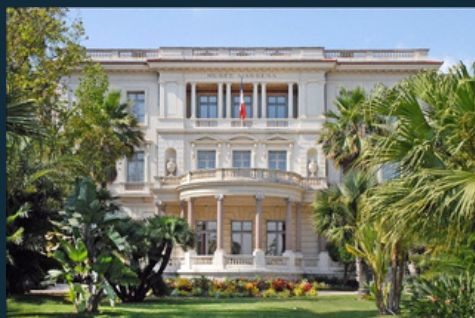
Musée Masséna