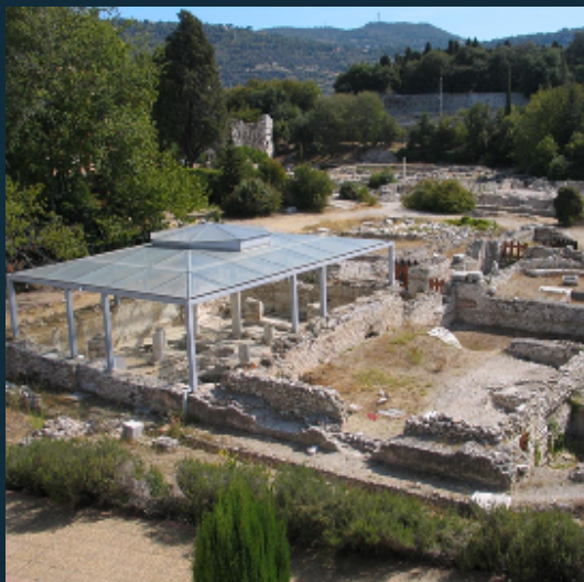
Site archéologique