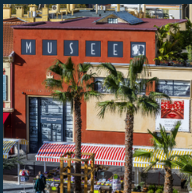
Musée de la Photographie, crédit : site internet du musée de la Photographie