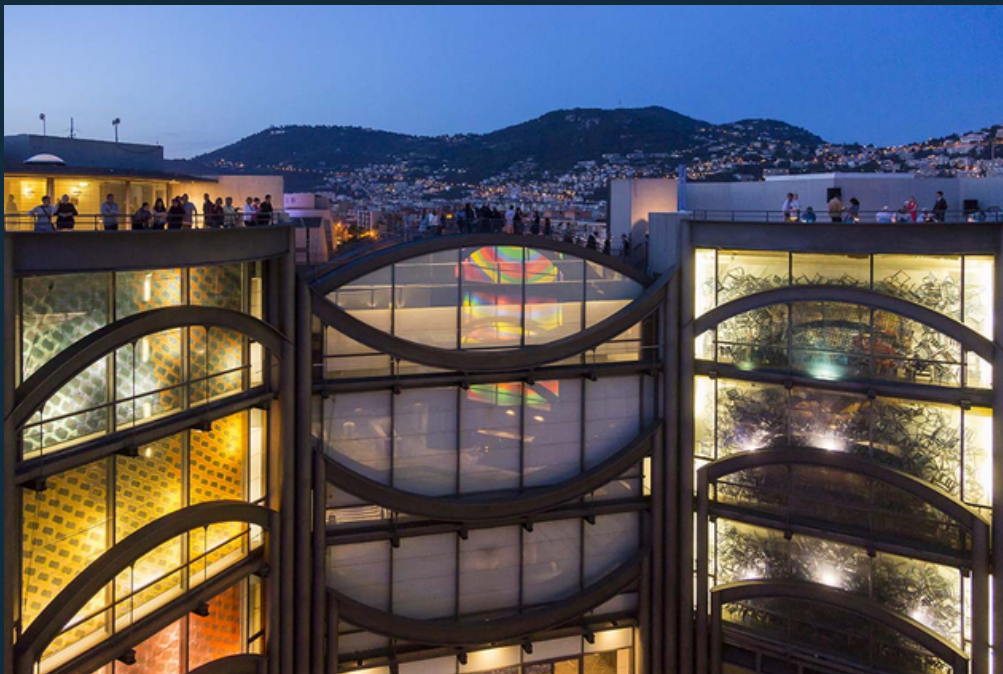
Le MAMAC