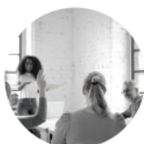
TABLE RONDE 18h00 à 19h30

Ouverture de la table ronde. Discussion et débat sur la place du numérique dans la communication à l'international.