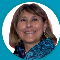
Sylvie CHRISTOFLE ESPACE/GRM