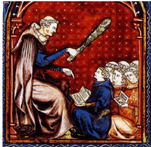
Gossouin de Metz, L'image du monde , vers 1325, BnF ms. fr.574.