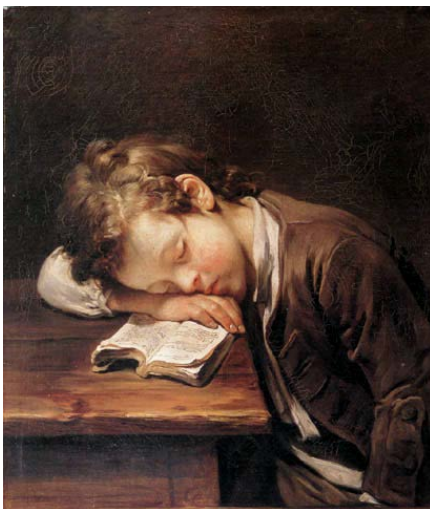
J.B Greuze, Un écolier endormi sur son livre , 1755, Montclair