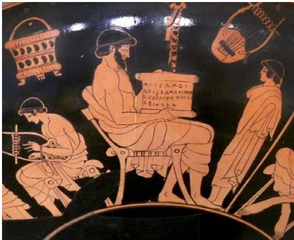
Coupe à figures rouges de Douris, vers 475 av. J.-C., Berlin