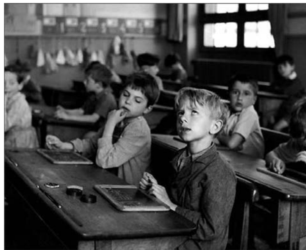
R. Doisneau, L'information scolaire , argentique, 1956