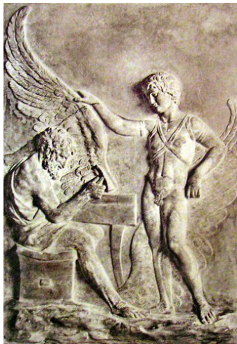
Dédale & Icare. Relief romain, Ile s. Villa Albani