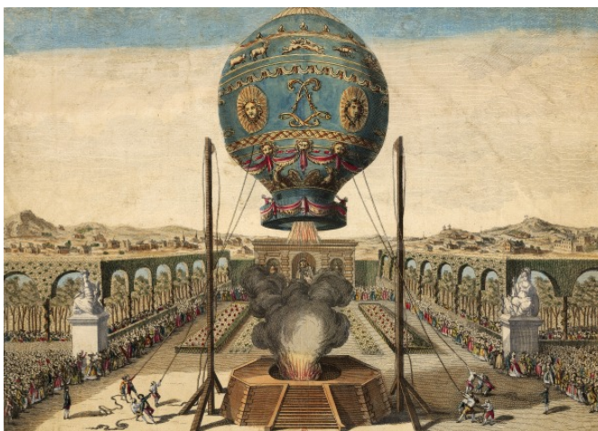
C.L. Desrais, L'expérience des frères Montgolfier , 1783, BNF FOL-IB-1