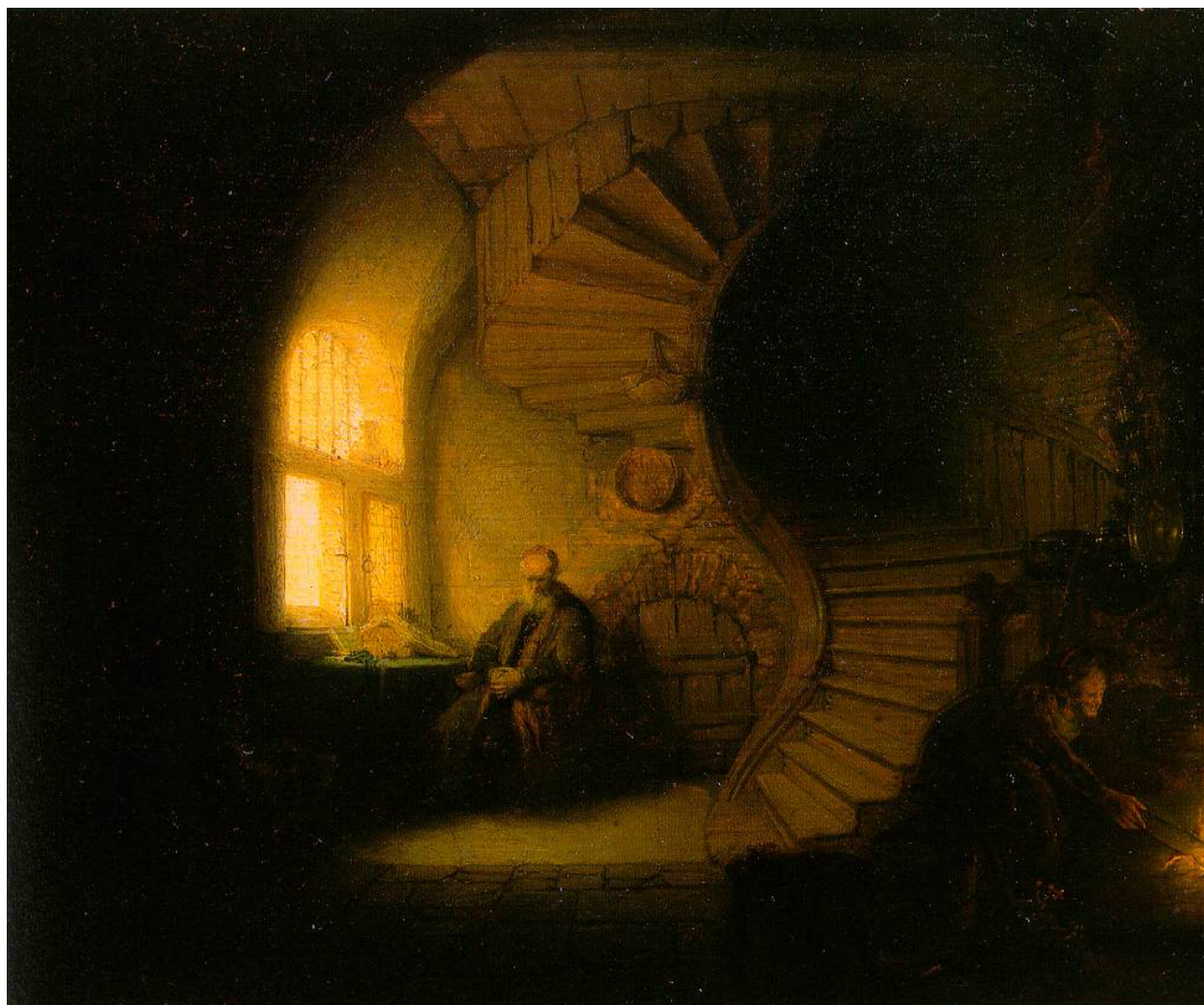
REMBRANDT, Philosophe en méditation (1632)