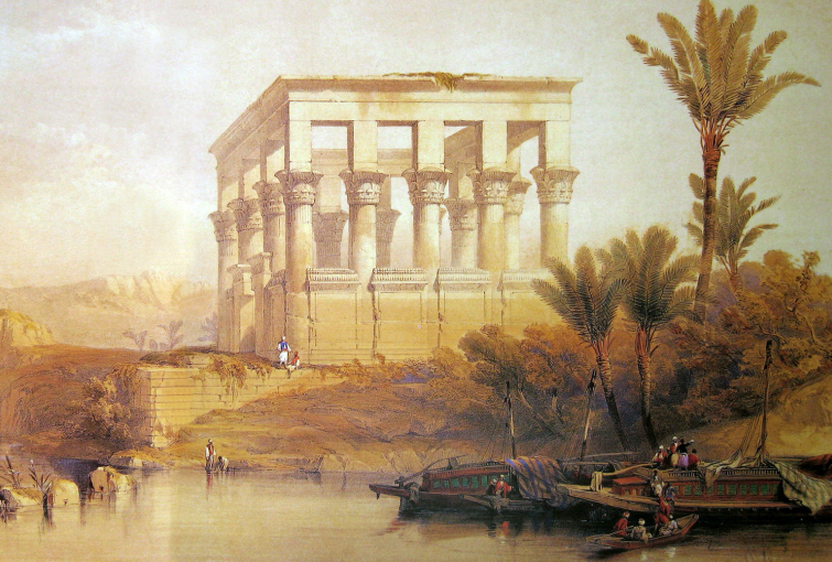
David Roberts, The Hypaethral Temple of Philae, 1838.