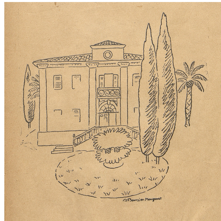
Institut d'Etudes Juridiques, Villa Passiflores, 1954

D'autres collections font partie de notre bibliothèque numérique, comme la collection IDERIC (Institut d'études et de recherches interethniques et interculturelles), qui réunit de publications et de documents de travail non publiés tout au long de l'activité du laboratoire homonyme (de 1966 à 1992).