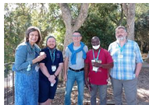
Photo : les quatre enseignants-chercheurs avec le directeur de l'ISA.

Plus d'informations sur le projet : nemedussa.ugent.be