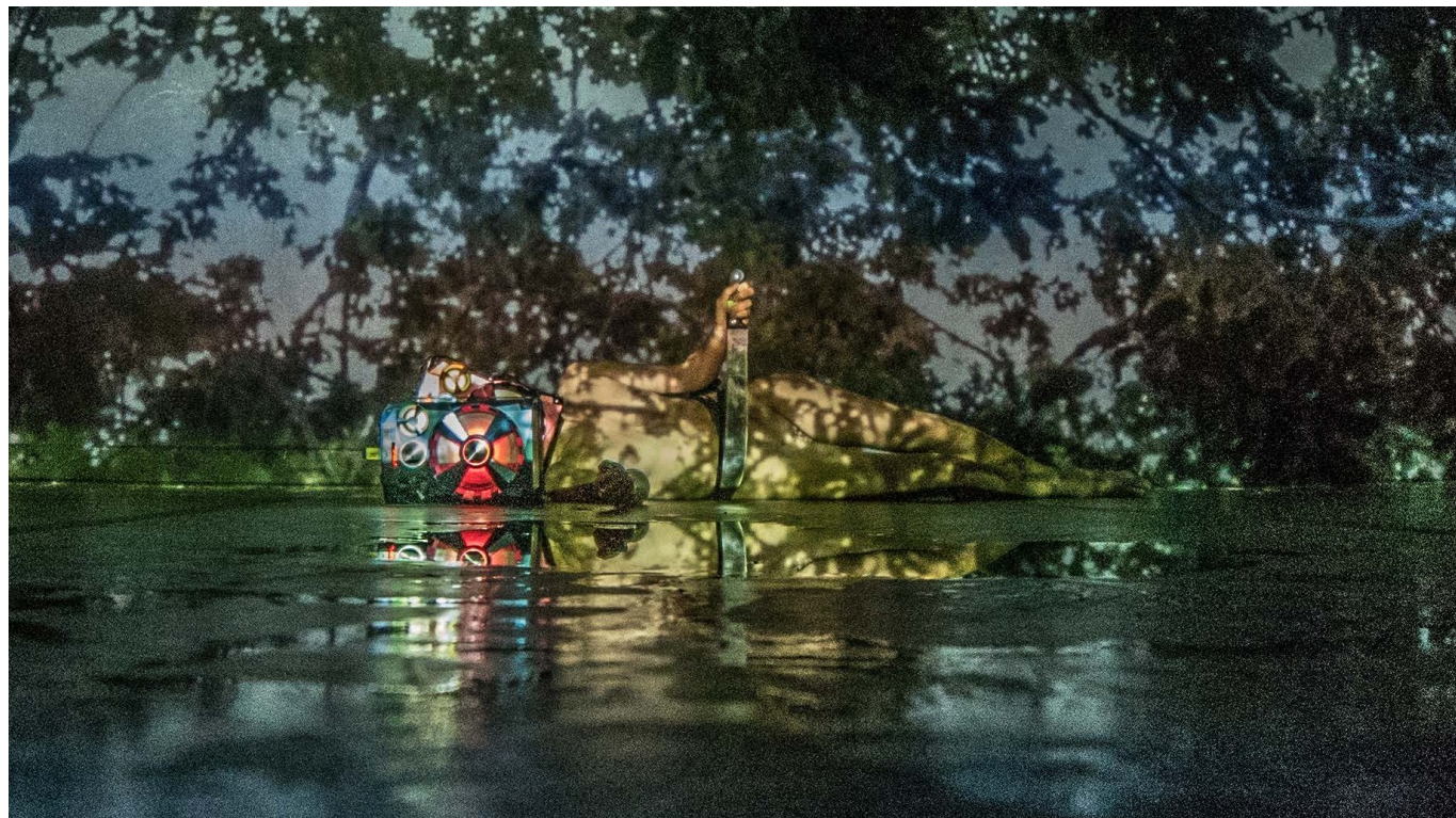
© Altamira 2042, Gabriela Carneiro da Cunha and Xingu, 2019.