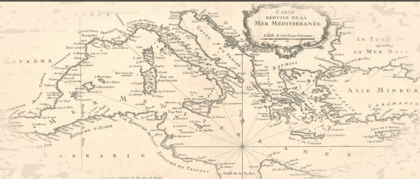
Image : J.-N. Bellin, Carte réduite de la mer Méditerranée, 1764".

DE LA FIN DU XVIII E SIÈCLE À LA PREMIÈRE GUERRE MONDIALE