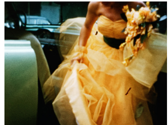
Journal d'Amérique

Depuis 2004, Arnaud des Pallières développe une fresque visuelle et sonore – une constellation de films – brossant des histoires américaines du XX e siècle, réinventées à partir d'archives provenant de la collection américaine Prelinger Archives qui réunit une immense collection de films anonymes des débuts du cinéma jusqu'à l'avènement de la vidéo dans les années 1970. Dix ans après Poussières d'Amérique (2011), le cinéaste poursuit son exploration américaine dans Journal d'Amérique comme on le ferait d'un continent disparu.