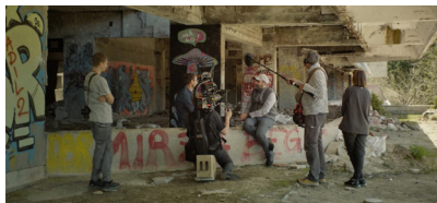
Affronter l'obscurité