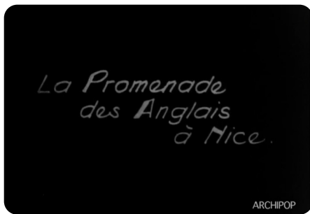
Nice (1950 environ)