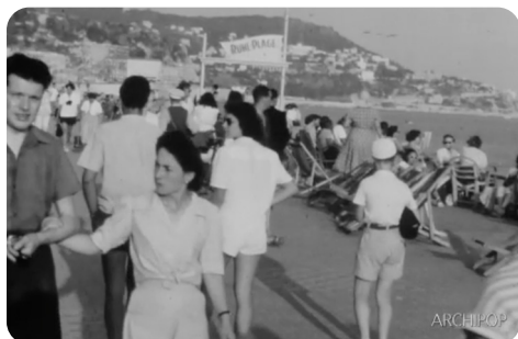
Nice (1950 environ)

En partenariat avec les associations DEL'ART et Archipop