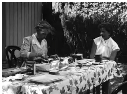
J'ai quitté l'Aquitaine