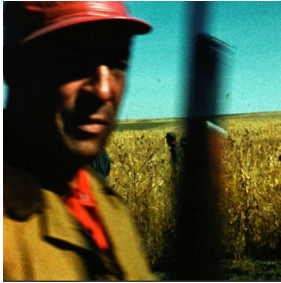
Journal d'Amérique