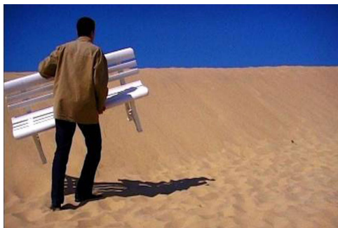
J'ai quitté l'Aquitaine