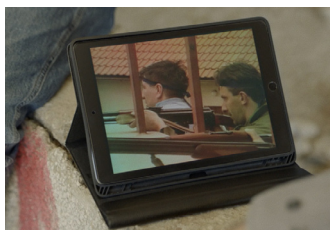
Affronter l'obscurité

Soirée de clôture avec La Bande Passante et le Pop-Up Cinéma au 109