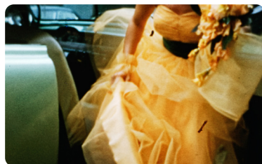
Journal d'Amérique

Projection du 23 octobre à l'Institut audiovisuel de Monaco