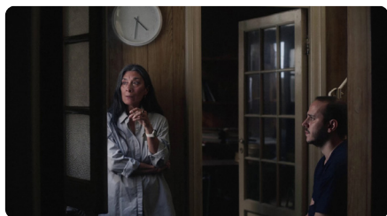
Las cosas indefinidas

Projection en avant première du film inédit en France, Las Cosas Indefinidas (2023, 86 min.) de Maria Aparicio , en partenariat avec le FID Marseille