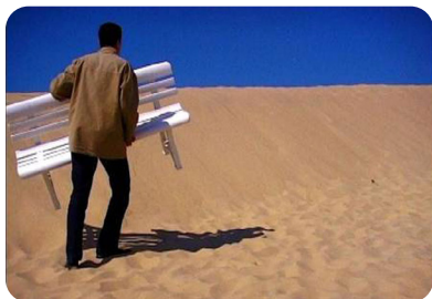
J'ai quitté l'Aquitaine ©Adav Europe