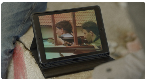
Affronter l'obscurité

Ciné-concert et projection du 27 et du 28 octobre à La Trésorerie et au Pop-Up Cinéma du 109