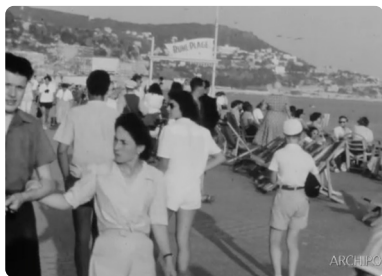
Nice (1950 environ)