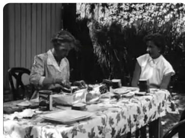
J'ai quitté l'Aquitaine

Projection du 24 octobre à l'Espace Mignan