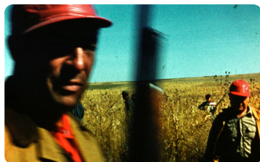
Journal d'Amérique ©Les Films de l'Atalante