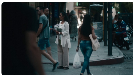
Las cosas indefinidas

Projection du 26 octobre à la Villa Arson