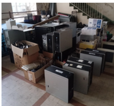
Gisement du don

A ce jour, cette opération comprend une quarantaine de PC en cours d'analyse et de reconditionnement avant leur mis à disposition.