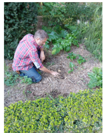
Technique de paillage au sol

La conjugaison de toutes ces actions protège non seulement la nature à l'échelle micro, et également permet certaines économies financières (consommation d'eau, utilisation d'engrais, déchetterie,...).