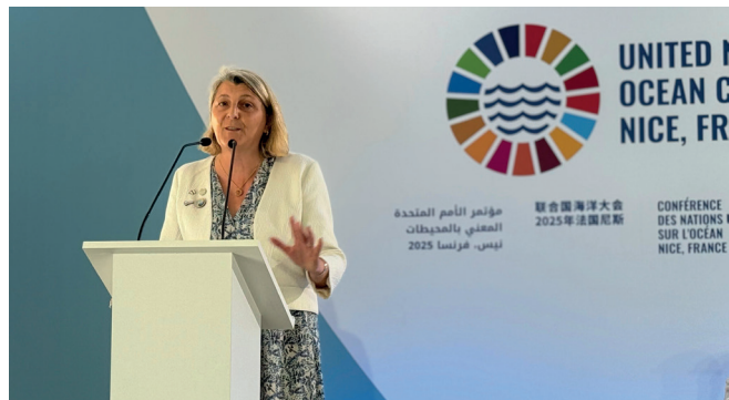
Lessons learned about ocean management from tropical experiences