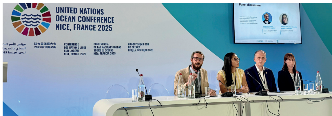
Bridging Science, Policy and Action: Enhancing cross-sectoral collaboration for inclusive and equitable ocean management and governance